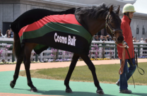
協力: 有限会社ビッグレッドファーム